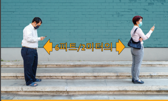
다른 사람과 6피트/2미터의 거리를 두십시오.