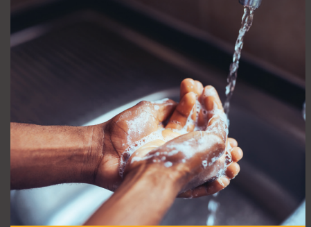
손을 자주 씻으십시오.